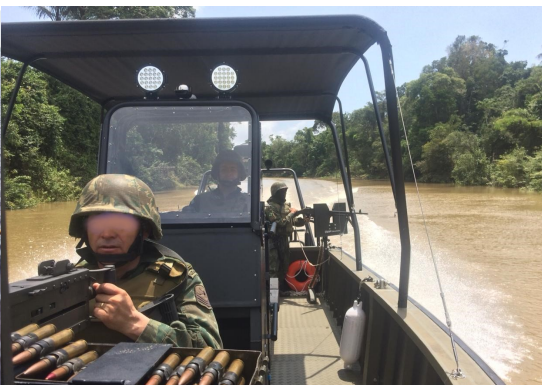
Reparos de Metralhadora .50 mm e 7,62 mm) Support for Weapons (.50 mm e 7,62 mm)