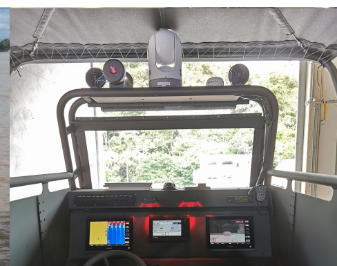
Equipado com GPS, Radar, Sonar, Visão Termal, Visão Noturna, etc Equipped with GPS, Radar, Sonar, Thermal Vision, Night Vision, etc.