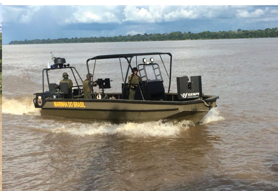
Excelente Manobrabilidade e Estabilidade Excellent Maneuverability and Stability